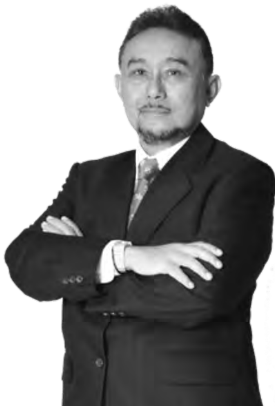
Komisaris Utama President Commissioner