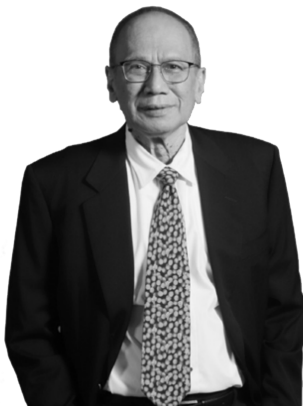
Komisaris Independen Independent Commissioner